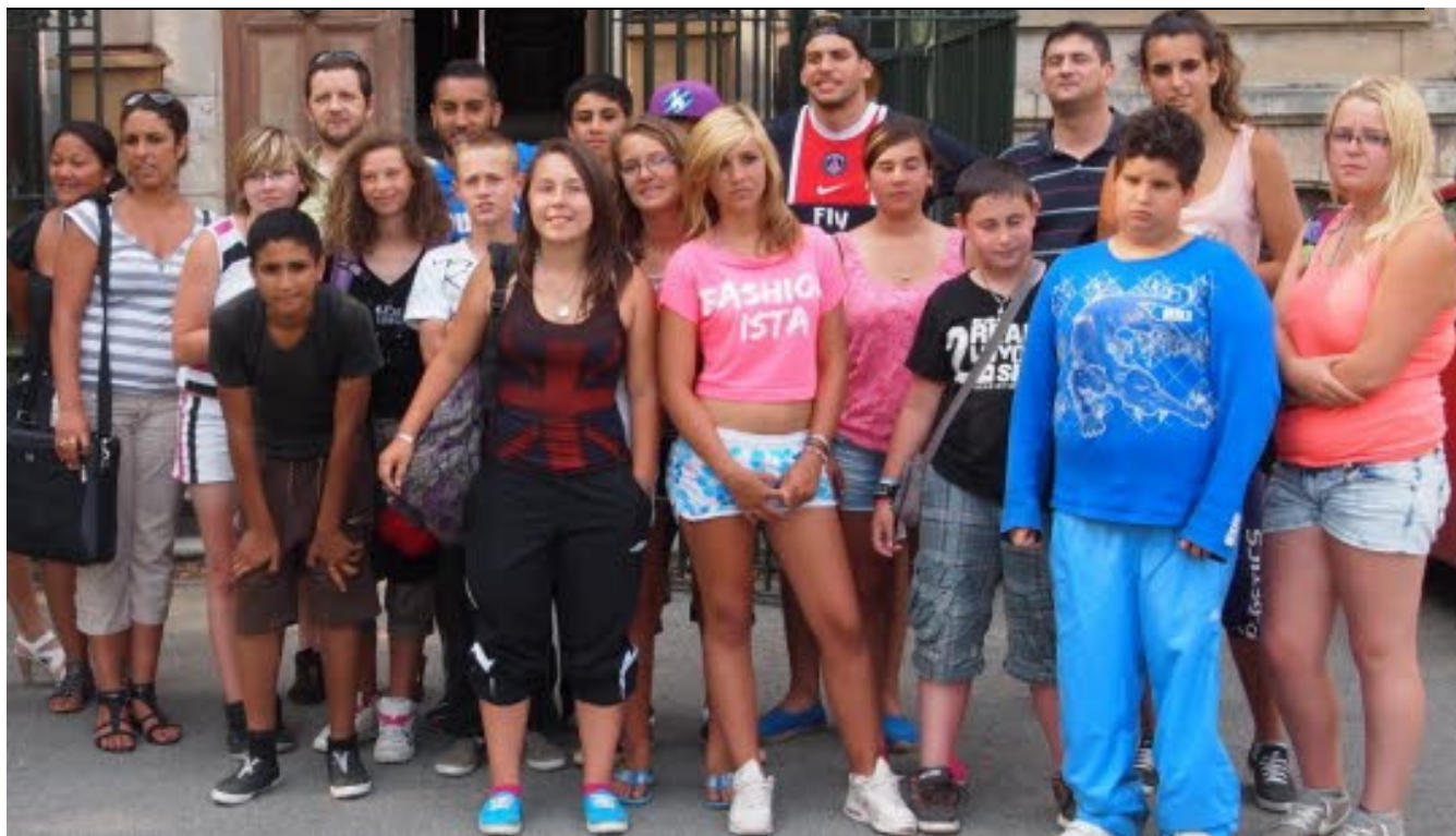
Les ados, très enthousiastes à leur retour de leur semaine de détente, ont été accueillis par les élus.

L'atelier-jeunes organisé par la commune de Morvillars s'est terminé vendredi soir. Une petite rencontre organisée au château communal a permis de dresser un bilan très positif de l'expérience vécue par 16 ados du village.