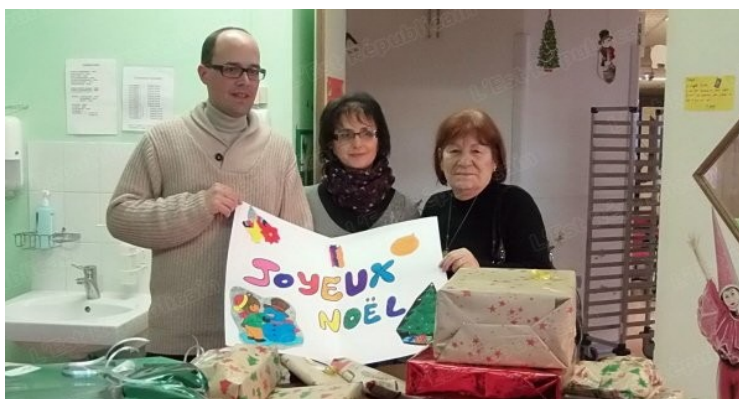
Une remise qui a fait des heureux

Après la collecte... la distribution. Voici quelques semaines que l'accueil périscolaire a lancé l'action de solidarité « un jouet pour un sourire ». Il s'agissait, avec les enfants et leurs parents, de récolter le maximum de jouets afin d'apporter joie et sourires aux enfants malades du service pédiatrique de l'hôpital de Belfort. Une première opération a consisté à répertorier, trier les jouets en bon état et de préférence sans pile. Puis ensuite de réaliser de jolis paquets cadeaux avant de jouer au père Noël.