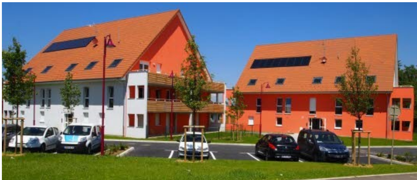
Les deux nouveaux immeubles sont situés, rue des Ouches, sur les hauteurs de Morvillars.