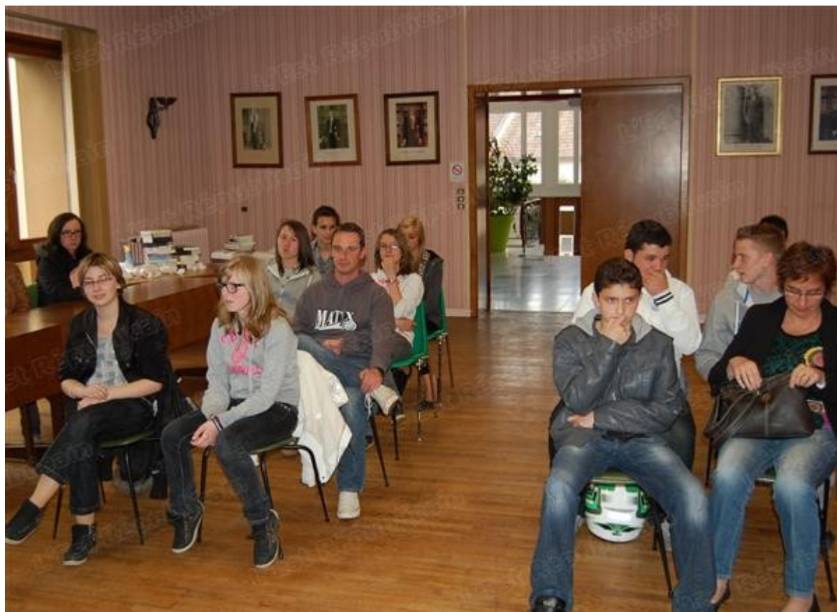
Des jeunes à l'écoute.