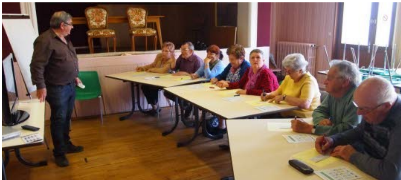
Une révision du code de la route très appréciée par les participants.

À l'initiative de la commune, des aînés du village de Morvillars participent actuellement à des séances de révision du code de la route.