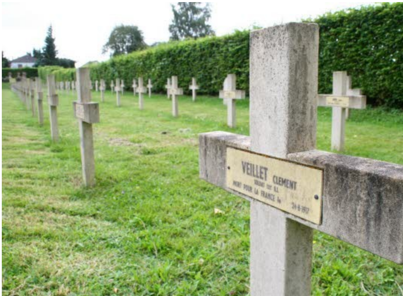
La nécropole de Morvillars : 156 tombes de soldats tombés durant la Grande Guerre.

156 soldats morts entre 1914 et 1918 sont enterrés dans la nécropole nationale de Morvillars. Pour le centenaire de la Grande Guerre, la commune compte mettre en valeur le site et évoquer ceux qui y sont inhumés. Un projet mené en partenariat avec les établissements scolaires.