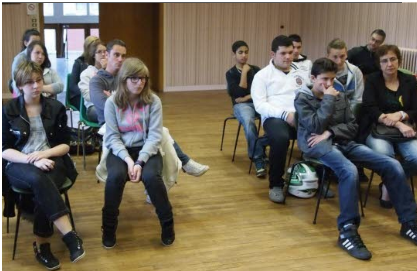
Les jeunes et leurs parents ont découvert le programme détaillé des activités prévues.

La mairie de Morvillars propose à nouveau cette année un atelier-jeunes destiné aux ados de 12 à 17 ans. Une expérience enrichissante qui associe une semaine de travail et une autre en séjour sous tentes consacrée aux loisirs.