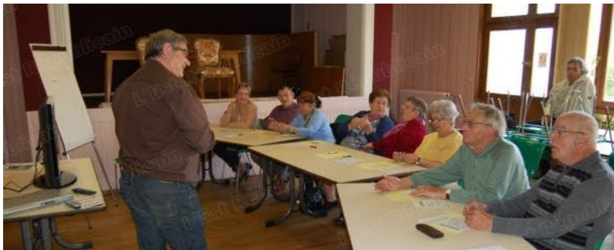
Des élèves studieux.