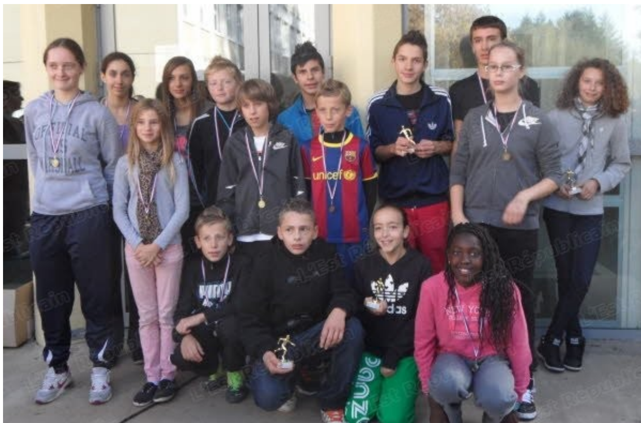
Les meilleurs de cette édition 2013 du cross du collège Lucie-Aubrac.

Le traditionnel cross du collège Lucie-Aubrac de Morvillars s'est déroulé vendredi matin et a profité d'une météo idéale. Un parcours d'une distance de 2.400 m, soit trois tours de 800 m autour du château, du stade et du collège, attendait les quatre catégories : minimes filles et garçons, benjamins et benjamines.