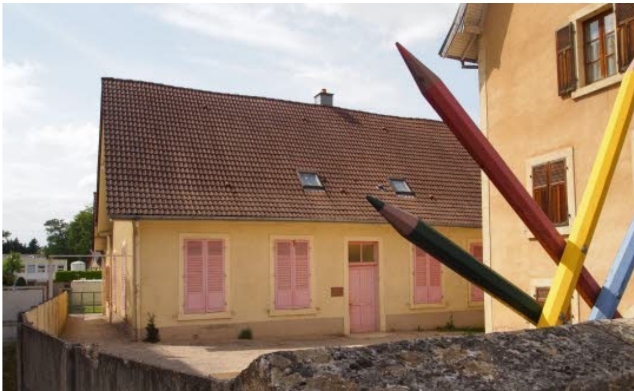
L'école La Familiale fermera définitivement ses portes le 5 juillet.

C'est désormais officiel, le 5 juillet prochain, jour des vacances scolaires, l'école privée La Familiale de Morvillars sera définitivement fermée, à la suite d'une fusion des trois écoles privées de Grandvillars et Morvillars.