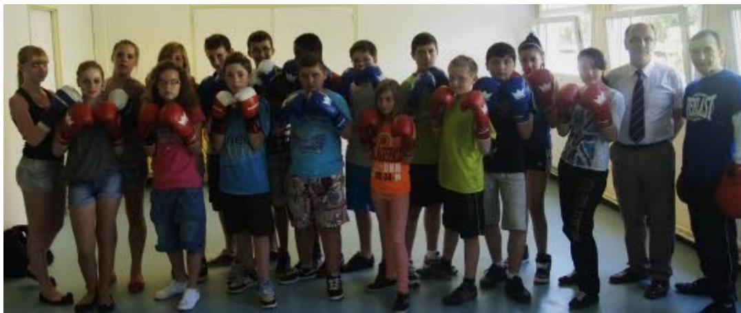
Les élèves de 5 ème conserveront d'excellents souvenirs de l'atelier boxe auquel ils ont participé cette année.

Dans le cadre d'une expérimentation sur les rythmes scolaires, le collège propose aux élèves, depuis deux ans, des ateliers sportifs et artistiques. Parmi ceux-ci la boxe a attiré de nombreux élèves qui comptent bien prolonger leur activité l'an prochain.