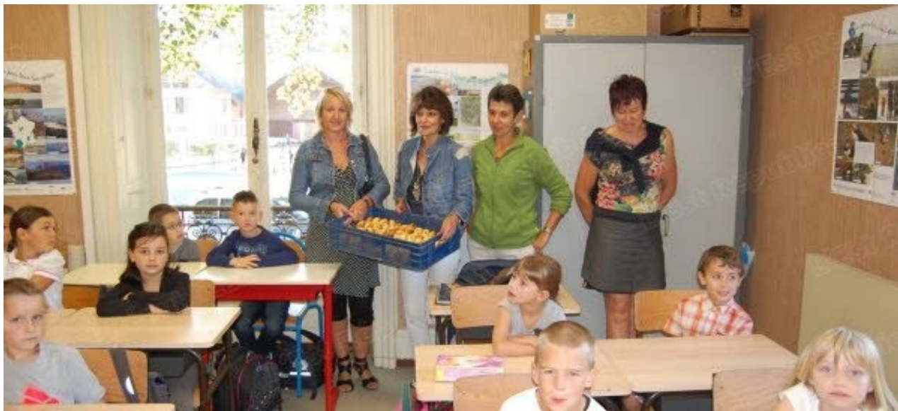
Distribution des petits pains.

Mardi matin, par une matinée fraîche et un beau soleil, toutes les petites têtes blondes, ainsi que parents et grands-parents étaient présents à l'école. Une rentrée qui se faisait sans la mise en place des nouveaux rythmes scolaires, les travaux d'aménagements de l'école et du périscolaire ne le permettant pas.