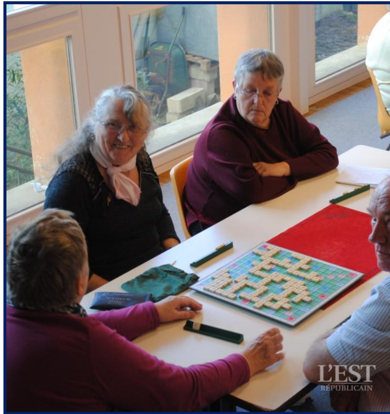
Les joueurs de scrabble

Le CCAS de Morvillars, sous l'impulsion de Lydie Baumgartner et de son équipe, lance à nouveau un temps de rencontre et de convivialité pour les aînés dans la salle de la mairie les 2e et 4e jeudis du mois de 14 h à 18 h. Belote, tarot, scrabble et jeux de société sont proposés.