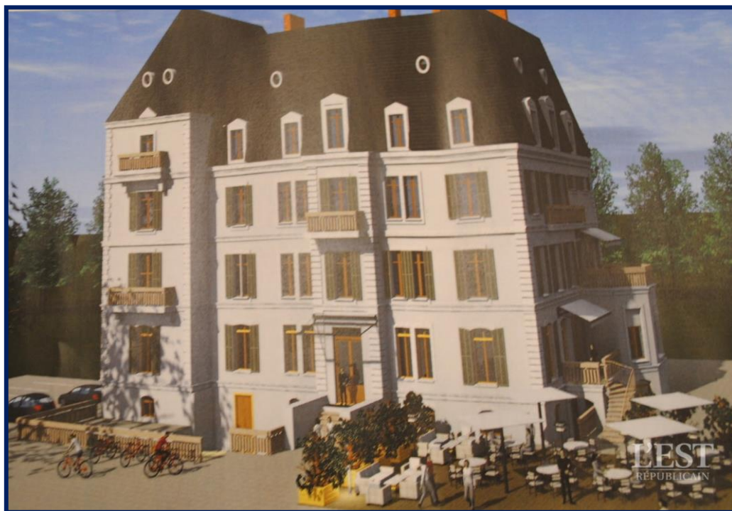
Maquette 3D de ce que pourrait devenir le château de Morvillars.