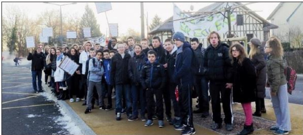
■ Le collège Lucie-Aubrac, à Morvillars, porte bien son nom : hier, il était en grève quasi totale.

Idem à Michel-Colucci, à Rougemont-le-Château : l'établissement prévoit deux élèves supplémentaires quand les services centraux en indiquent neuf de moins. « Pour ce petit différentiel, on perdrait deux classes », pestent les enseignants qui étaient en grève à 80 % lundi.