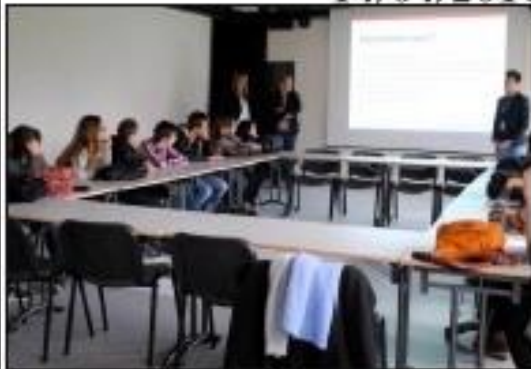
■ Les 15 élèves de 3 e à écoute des trois apprentis.