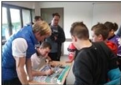
■ La rencontre avait pour cadre un projet auquel ont participé huit établissements du département.

Le projet départemental « Rame en 5 e » initié par les enseignants d'EPS du collège Simone-Signoret de Belfort, comptait trois étapes.