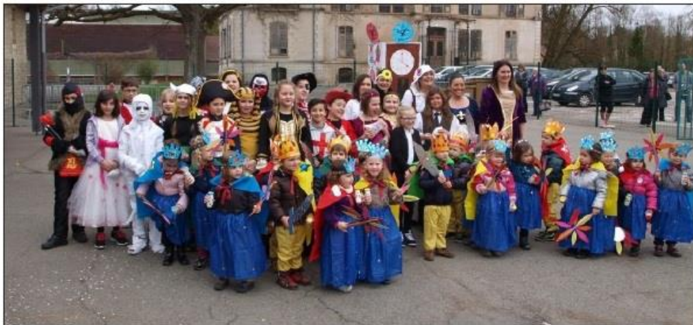
■ Une partie des élèves déguisés avec les enseignantes et derrière eux, le bonhomme d'hiver.

Un goûter composé de boissons, beignets et gâteaux, préparé par les parents, les attendait au retour.