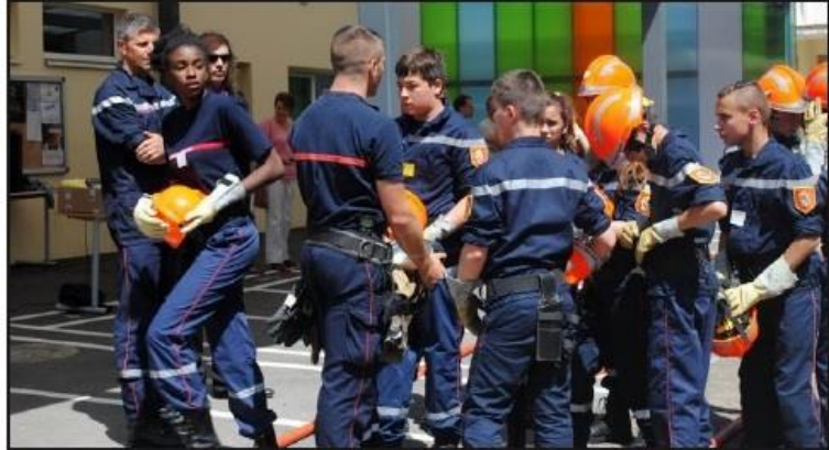
■ Les JSP revenant de manœuvres.

Mme Girolimetto a ensuite récompensé les élèves de 3 e du certificat de compétence de formation aux premiers secours. Isabelle a ensuite valorisé les élèves (5 e et 3 e )