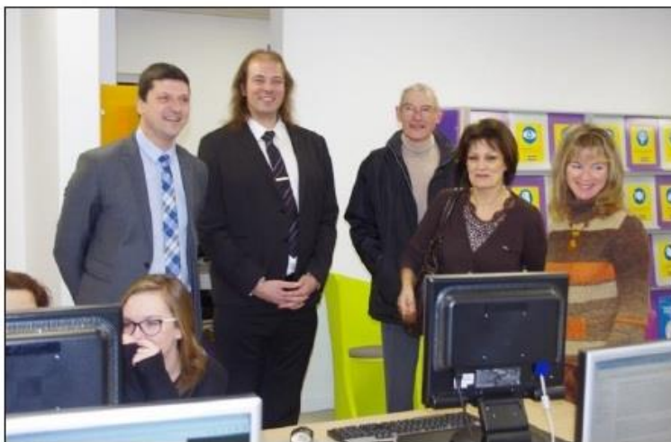
■ Les élus ont pu constater que les équipements profitent aux élèves.

Confié au bureau d'études Cetec et Enebat, dix entreprises ont contribué à sa réalisation à hauteur de 310.000 euros dont 236.000 euros pour les travaux proprement dits, 48.000 euros pour les équipements et 26.000 euros pour le mobilier. La nouvelle salle audio-