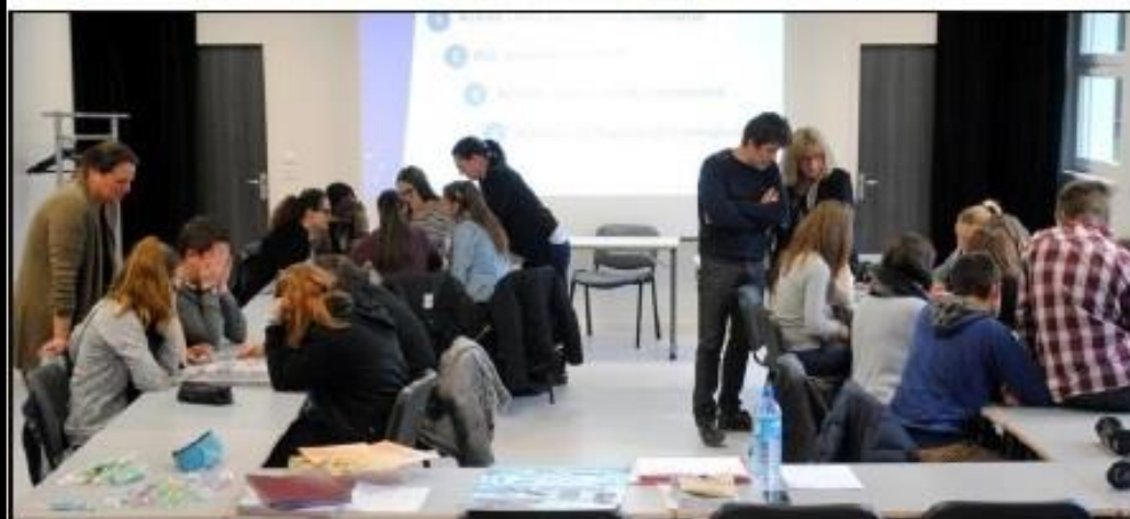
■ Les élèves, aidés par l'encadrement, se livrent à un quizz sur la création d'entreprise.

Satisfaits de cette expérience, les collégiens sont sortis rassurés et enthousiastes quant à la création d'entreprise et il est à parier que de futurs chefs d'entreprises sortiront des rangs du collège Lucie-Aubrac.