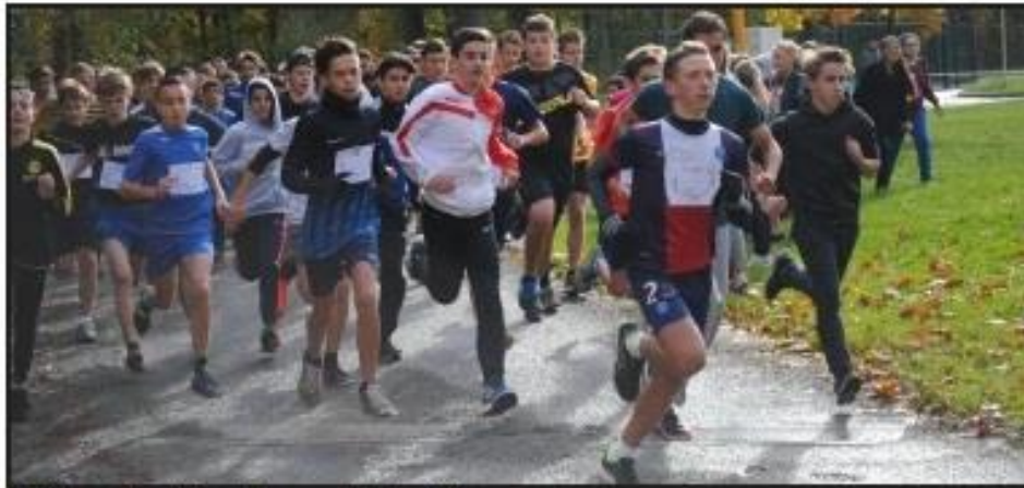
■ Un beau départ des minimes cadets et adultes garçons.