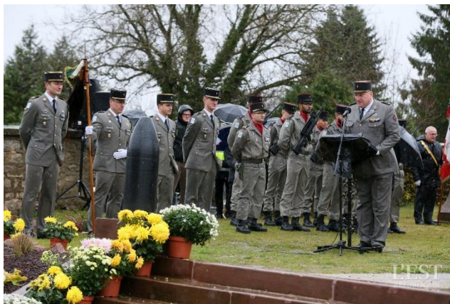
Cérémonie officielle à la nécropole, en présence des autorités militaires.