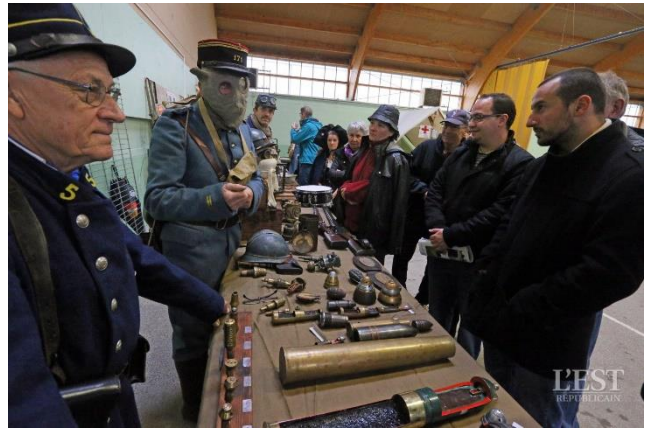
Une exposition sur les munitions de l'époque