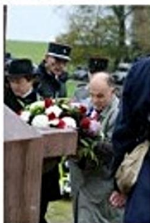
L'hommage des anciens combattants.