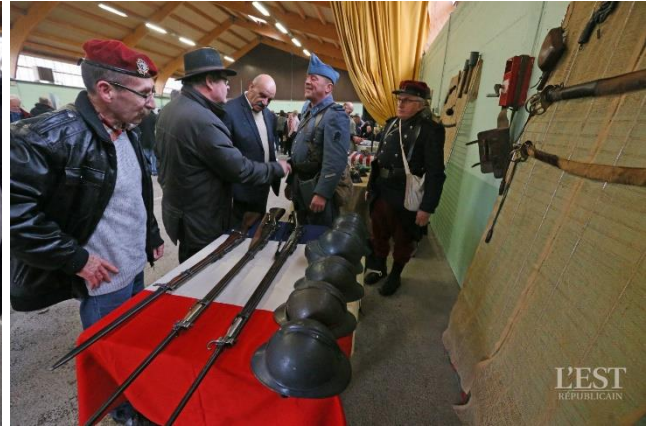
Objets de l'époque.