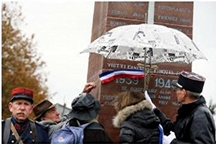
Enfin une inscription pour Ernest Viot, « mort pour la France » et oubliée.