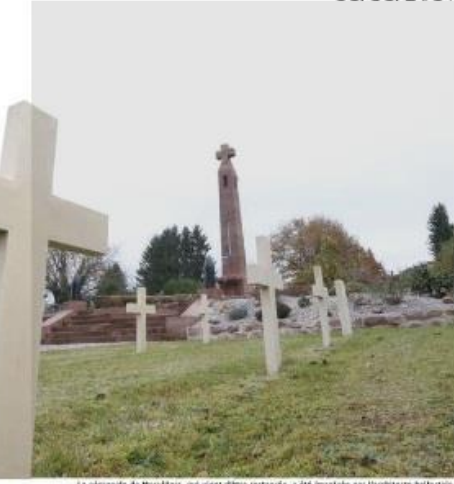
La nécropole de Morvillars, qui vient d'être restaurée, a été inaugurée par l'architecte lui-même Robert Danis et inaugurée en 1923.

Le style d'élite subtil, esprit novateur et frondeur. Ancien en apparence de l'architecture française des XIX e et XX e siècles, il a travaillé au premier plan de la construction française de la fin du XIX e siècle jusqu'à son décès en 1953.