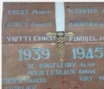
Le nom d'Ernest Viotti a été gravé sur le monument de la nécropole.

Le souvenir des trois frères Viotti sera ravivé le dimanche 12 novembre lors de l'inauguration des travaux d'entretien et de rénovation de la nécropole nationale de Morvillars, en présence de nombreuses personnalités et de plusieurs de leurs descendants. Un oubli aujourd'hui réparé.