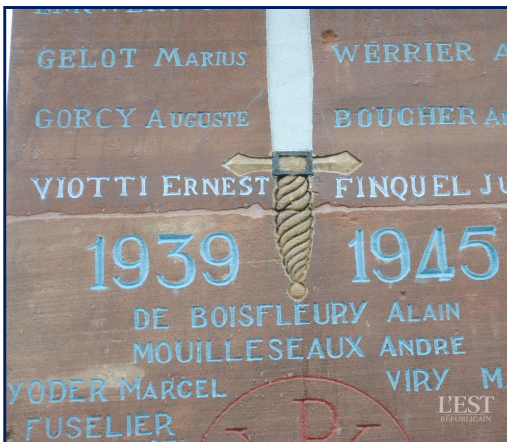
Le nom d'Ernest Viotti a été gravé sur le monument de la nécropole.

Le souvenir des trois frères Viotti sera ravivé le dimanche 12 novembre lors de l'inauguration des travaux d'entretien et de rénovation de la nécropole nationale de Morvillars, en présence de nombreuses personnalités et de plusieurs de leurs descendants. Un oubli aujourd'hui réparé.