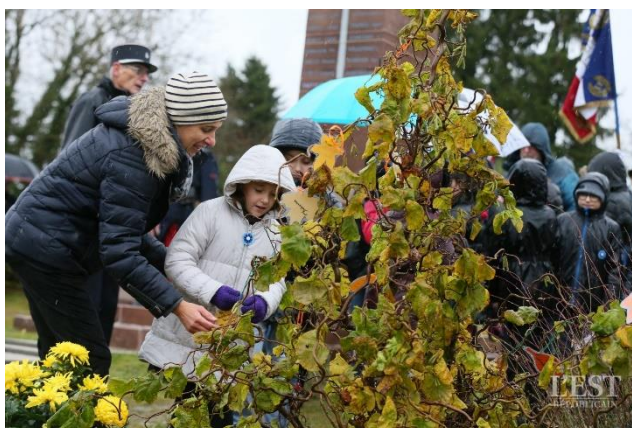
L'arbre planté par les écoliers à la nécropole.