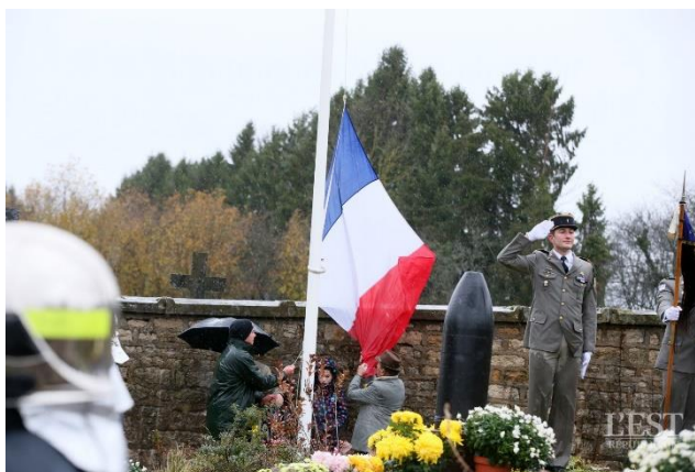
Cérémonie officielle à la nécropole, le 12 novembre 2017, pour l'inauguration de la rénovation.

La candidature Unesco a été abandonnée, jugée coûteuse et aléatoire. Elle aurait pu aussi compromettre le développement durable de la commune.