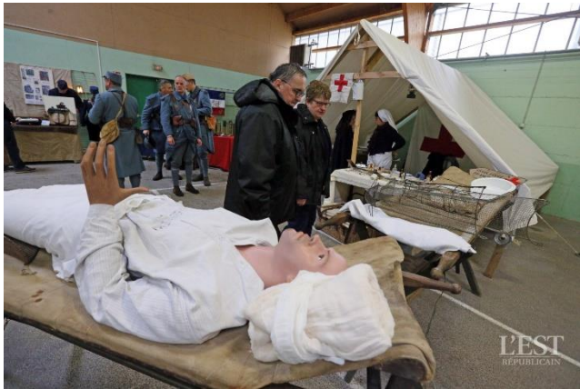
Souvenir de l'ambulance