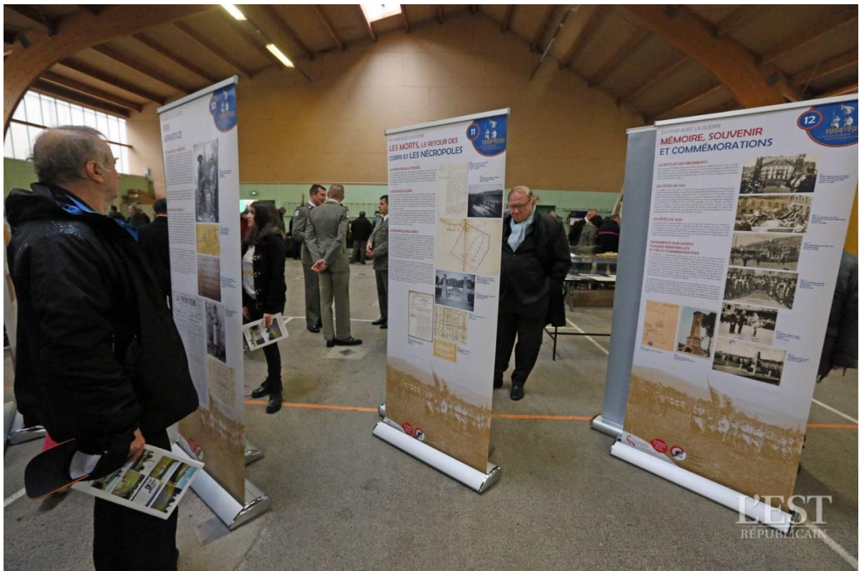
La grande histoire résumée en panneaux recto-verso.