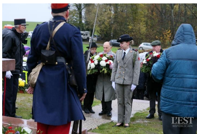
Cérémonie officielle à la nécropole.