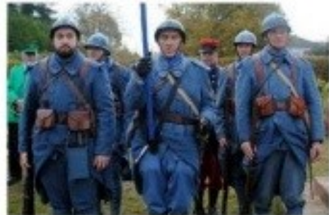
Les soldats français de l'Association Transhumaine et Traditions.