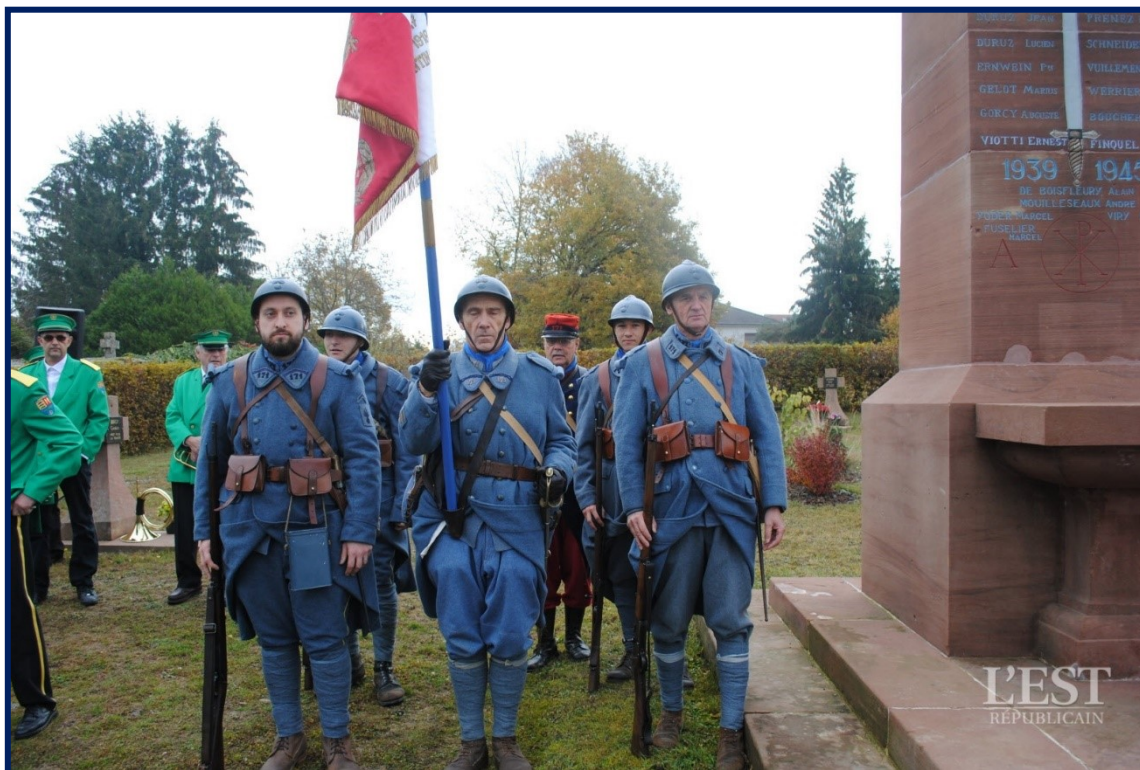
Les poilus français de l'association transhumance et traditions

Les communes ont célébré le centenaire de la fin de la Première Guerre mondiale ce dimanche un peu partout dans le Territoire de Belfort. Ecoliers et anciens combattants ont accompli le devoir de mémoire devant une foule nombreuse, centenaire oblige, et rendu hommage aux Poilus qui sont morts sur les champs de bataille entre 1914 et 1918.