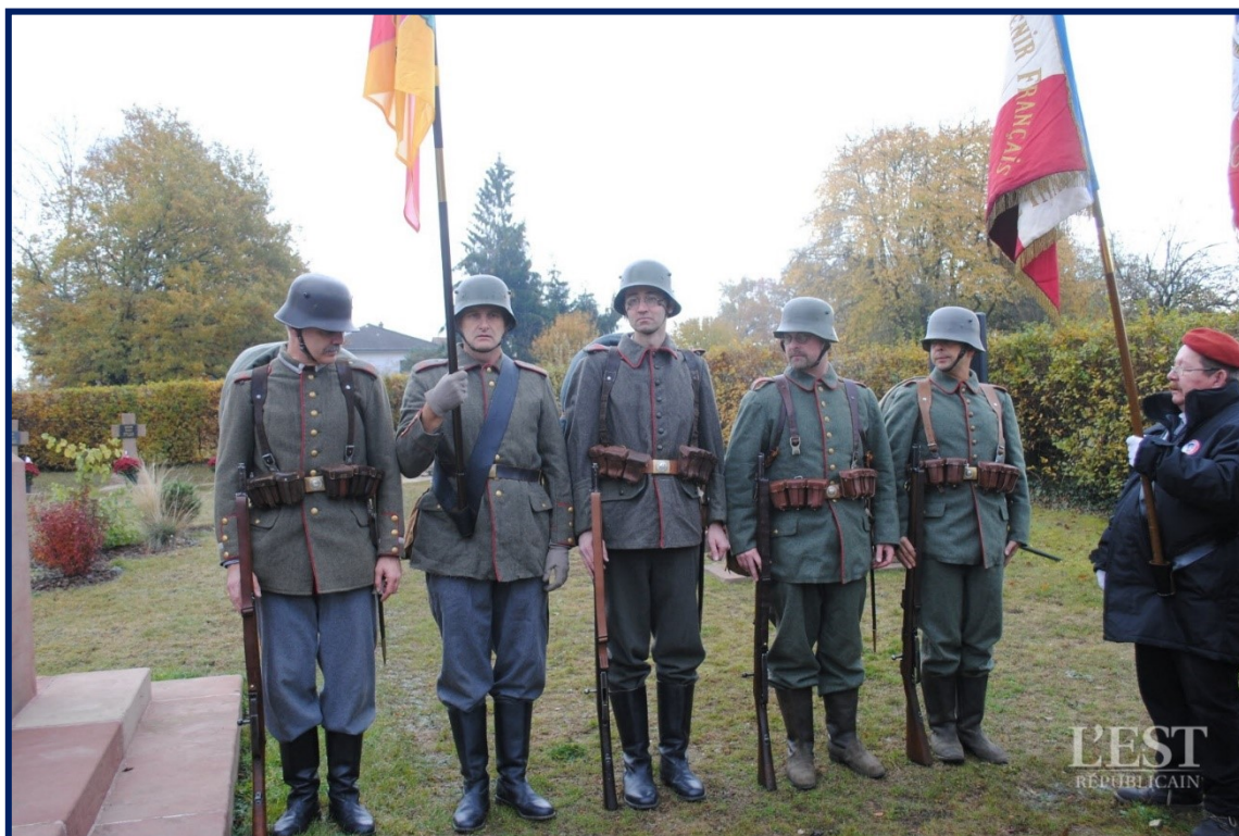
Les soldats allemands de l'association landwerth de Lorrach