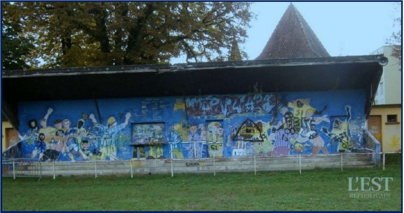
Les tribunes du terrain de football