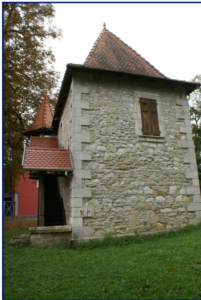
Tour dite tour de l'arbitre