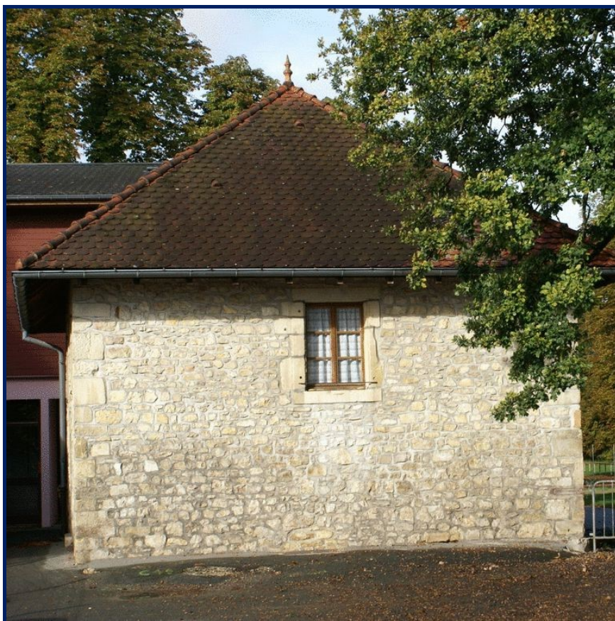
La Tour Carrée

collège jusqu'à la médiathèque communale. Enfin le projet vise à limiter le libre accès à deux bâtis anciens : la Tour Carrée du XV e et la Tour de l'Arbitre, qui sont des vestiges d'une ancienne maison forte.