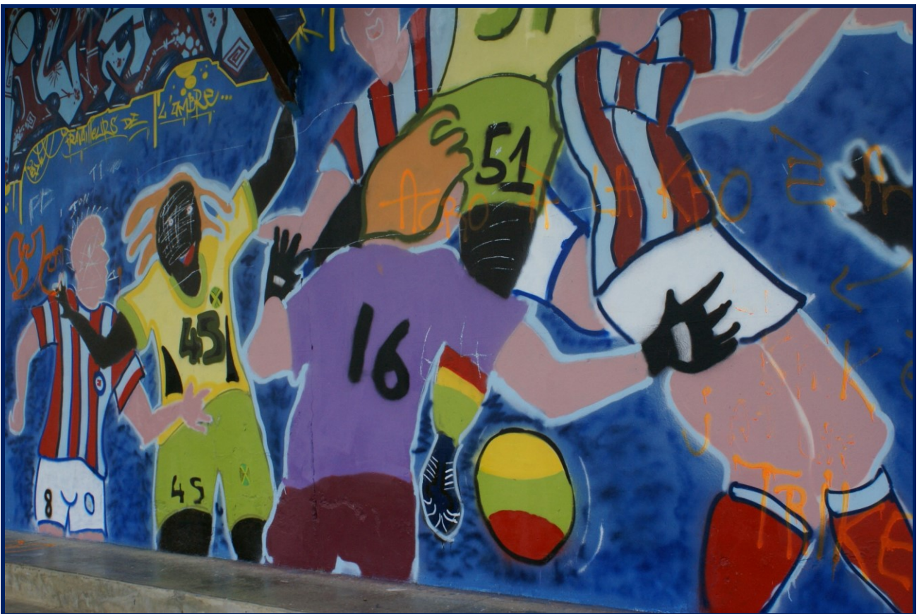
Une fresque avait été réalisée en 2007 par l'atelier jeunes