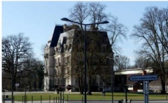
Un aménagement qui transformera complètement le secteur et qui s'élèvera à 238 000 euros.

6 grands arbres liés au parc du château communal et qui sont aujourd'hui bien trop proches de l'école et de la Tour de l'Arbitre devraient être abattus.