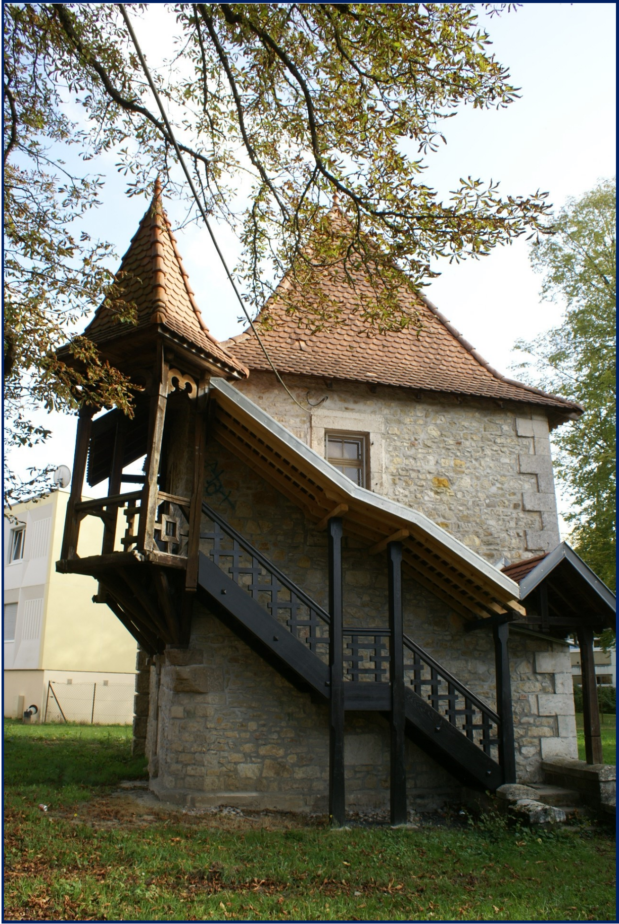
La Tour dite de l'arbitre