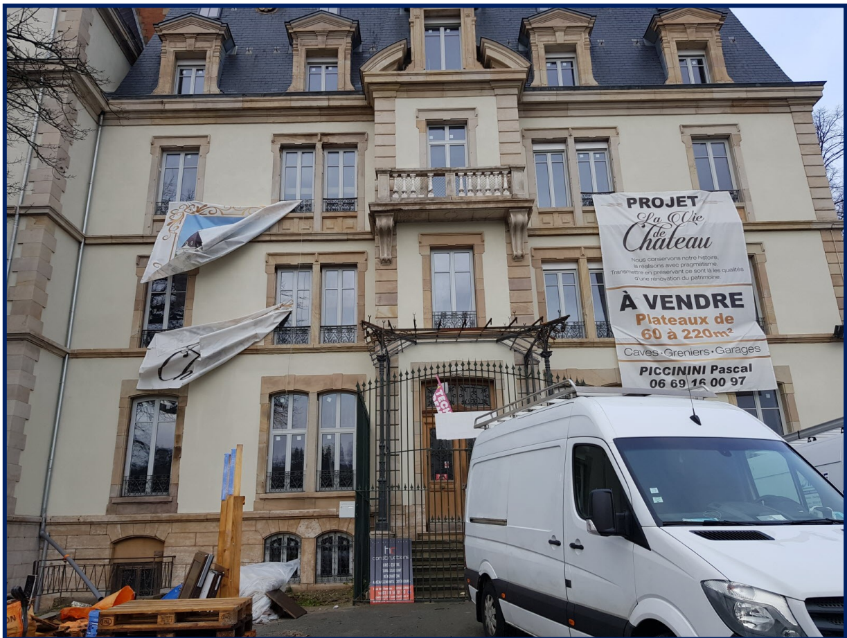
Le château, acheté à la commune par Pascal Piccinini, est en vente en appartements. La rénovation est en cours. À noter, des fenêtres de toit et menuiseries qui s’intègrent parfaitement à l’ensemble.