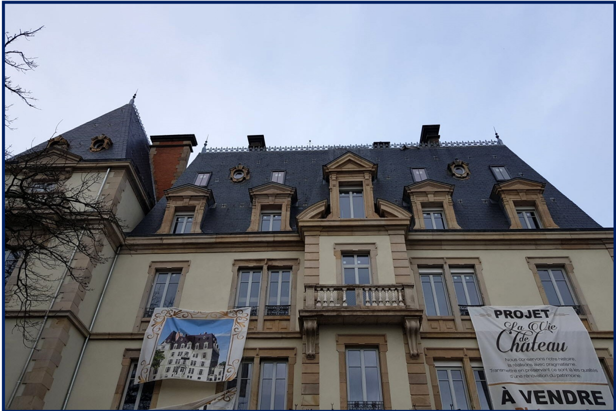
Le château a été construit vers 1872 pour Armand Viellard, industriel et homme politique. Il a porté cinq noms différents, dont « château communal » puisque les associations s’y réunissaient jusqu’à peu.