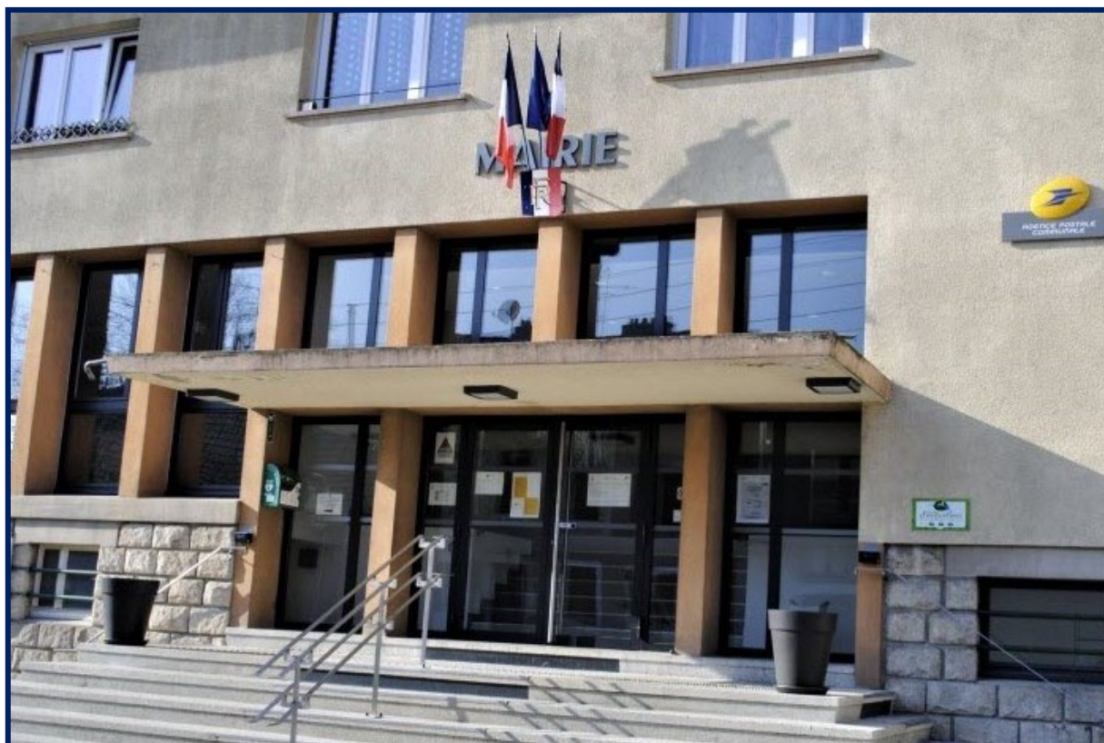
Rénovation et isolation sont au programme.

Au cours de la réunion du conseil municipal de Morvillars, jeudi 21 janvier où un seul membre était absent, les différents points de l'ordre du jour exposés ont tous été adoptés à l'unanimité.