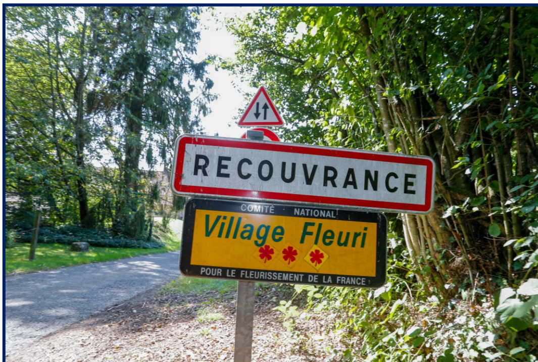
Recouvrance a connu une augmentation de sa population de 5,68 % par an sur cinq ans.

C'est Recouvrance (+ 5,68 %) qui augmente le plus sa population en proportion, tandis que c'est Fontenelle qui régresse le plus (- 4,61 %).