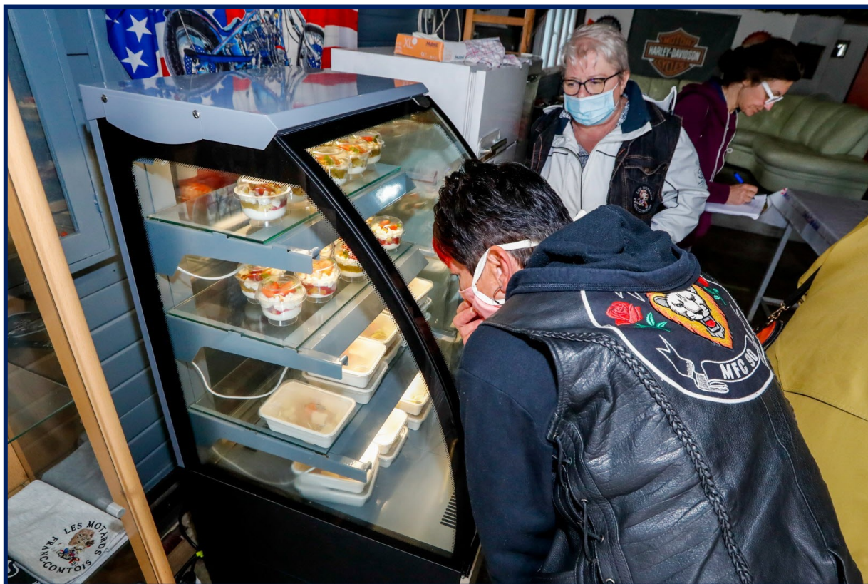
Les Motards Francs-Comtois prêtent leur local situé dans la zone industrielle de Bourogne-Morvillars aux agriculteurs et producteurs de toute l'Aire urbaine afin de créer un marché.