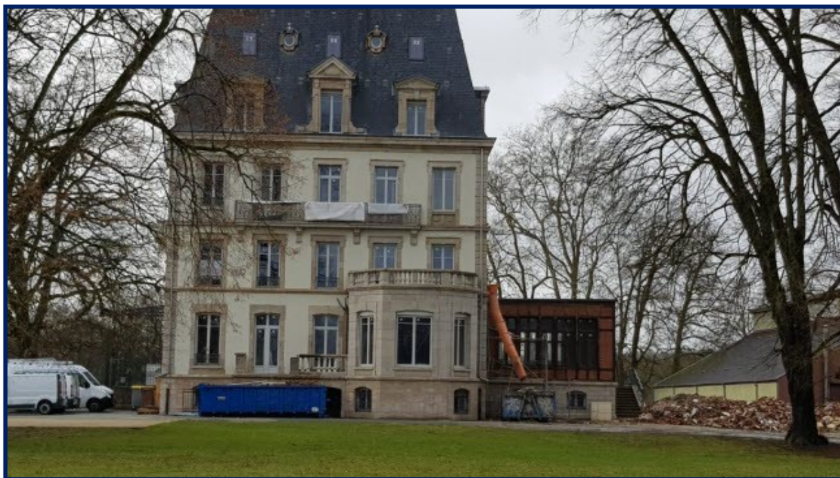
Le château de Morvillars en rénovation, vendu en appartements : respect des éléments du patrimoine et sauvetage de ce qui peut l'être, pour lui garder son caractère.